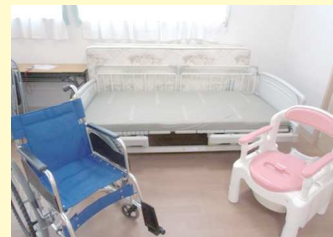
演習器材例 (ベッド、車いす、ポータブルトイレ)