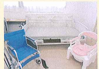
演習器材例 (ベッド、車いす、ポータブルトイレ)