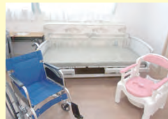
演習器材例 (ベッド、車いす、ポータブルトイレ)