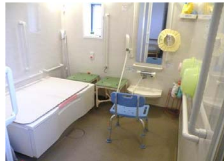
好きな時間に入れる浴室(個浴です)