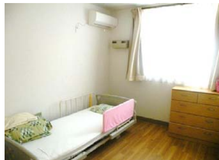
南面の明るい居室(5室)

広々としたリビング(通い定員15名) 手作りの食事を食べて、のんびりと過ごせます。 歩行器を使った歩行訓練も出来ます。 習字や絵手紙等のクラブ活動も行ってます。